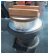
もみがらを燃料にした「ぬか釜」

平成23年に郷土料理「きりざい」をベースにした、ご当地グルメ「南魚沼きりざい丼」を通じて、南魚沼市を全国にPRする団体「南魚沼きりざいDE愛隊」が、市内の有志ボランティアにより誕生しました。おもな活動は、市内や県内外のまちおこしイベントへの出展や小学校での講演、農業者と連携した南魚沼産コシヒカリの田植えや稲刈りを、地元の人たちが学生と行っています。 平成25年には、愛Bリーグ（一般社団法人）ご当地グルメでまちおこし団体連絡協議会で、新潟県初の本部加盟団体となりました。 これからも全力で南魚沼市を全国にPRし、一人でも多くの人から市を訪れていただけるように、「まちおこし」活動に取り組んでいきます。