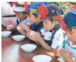
南魚沼産コシヒカリ新米昼食会