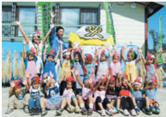
「南魚沼市コシヒカリの日」 制定記念イベント（めぐみ野保育園にて）