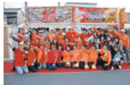
2013年、全国大会のB-1グランプリ in 豊川に初出展

For further promotion of Minamiuonuma Koshihikari rice, a special regulation was established according to a congressional proposal at Minamiuonuma City regular local assembly held in September 2013. This regulation promotes various approaches for the spread and promotion of Minamiuonuma Koshihikari rice by the cooperation between residents, related companies and the city.