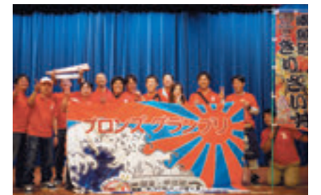
2013 関東・甲信越B-1グランプリ in 勝浦で ブロンズグランプリ(総合3位)を獲得