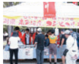
らいすぬーぼー in 浅草