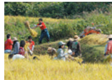
地域の人と稲刈り交流