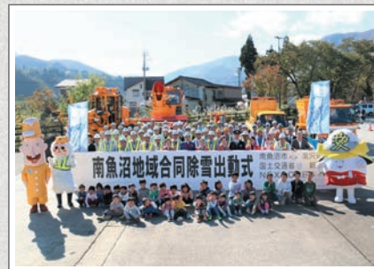
南魚沼地域合同除雪出動式