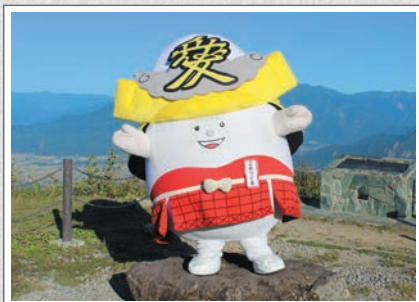
魚沼スカイライン