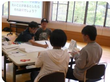
南魚沼市の魅力や自慢って何だろう? どんどん意見が出てます

第1ラウンドの質問は、「南魚沼市に魅力や自慢したいことがあるとしたら、それは何でしょう?」です