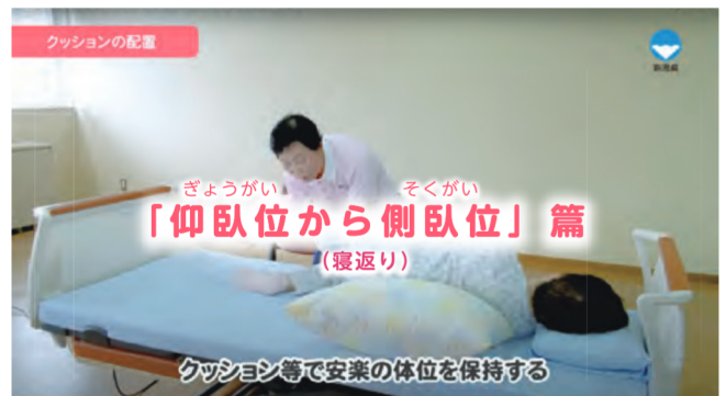
在宅介護に必要な基本介護技術「仰臥位から側臥位」篇