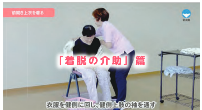
在宅介護に必要な基本介護技術「着脱の介助」篇