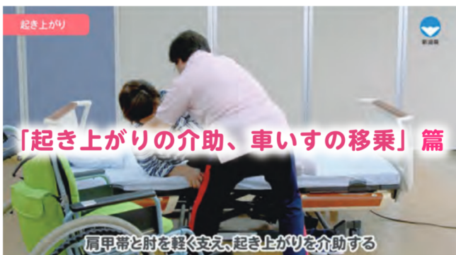
在宅介護に必要な基本介護技術「起き上がりの介助、車いすの移乗」篇