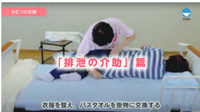
在宅介護に必要な基本介護技術「排泄の介助」篇

「県民介護知識・技術習得講座」で学ぶ介護実技等の一部をわかりやすく説明する動画をご視聴いただけます。